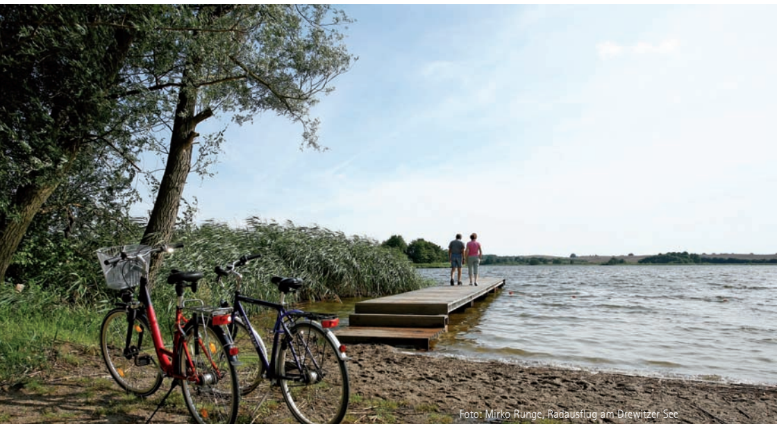
Radausflug am Drewitzer See