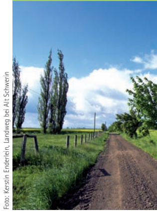
Landweg bei Alt Schwerin